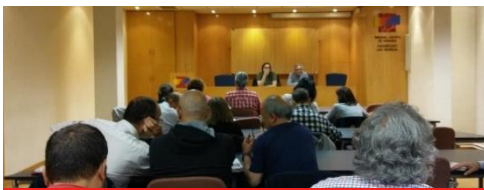
17/05/2018. Asamblea FSC-Navarra: El Acuerdo para la mejora del empleo público

Acuerdo en el sector público CCOO área pública