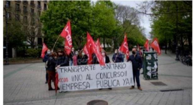
CCOO convoca una concentración para reclamar la paralización de la licitación del transporte sanitario y la creación de una empresa pública que gestione el servicio. MIGUEL OSÉS