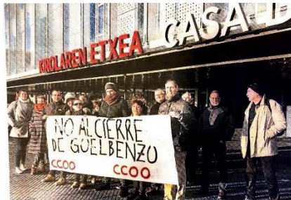
CCOO exige la reapertura de Guellenzo. La plantilla de Guellenzo y usuarios de la instalación deportiva-recreativa se concentraron ayer martes frente a las oficinas del Instituto Navarro del Deporte para exigir la reapertura de la instalación. En un comunicado, el sindicato recordó...