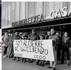
Trabajadores y usuarios concentrados ayer junto al Navarra Arena.