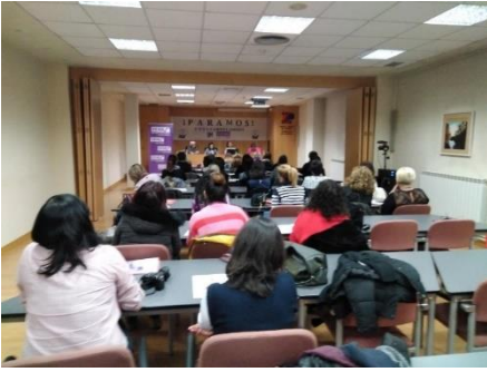
20/02/2019. Encuentro de Mujeres Sindicalistas. Hacia el 8M! Construyendo en Femenino