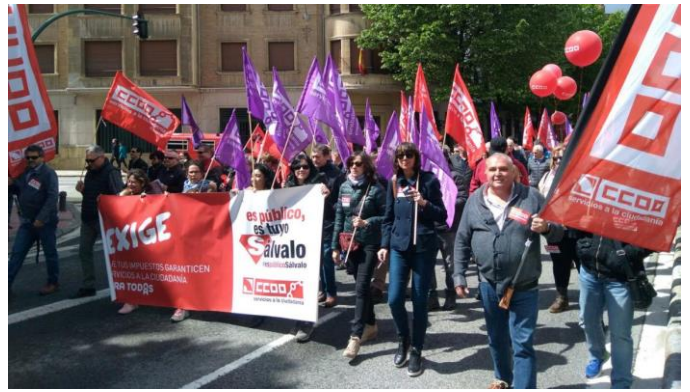
01/05/2018. Un Primero de Mayo Rojo y Violeta