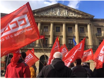
16/04/2018. CCOO vota NO a la OPE