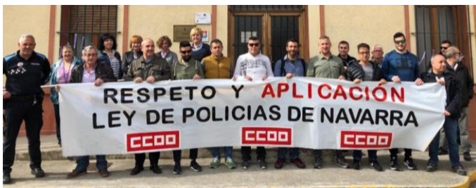
15/04/2019. CCOO se concentra en Castejón para exigir la aplicación de las retribuciones contempladas en la Ley Foral de Policías para las y los policías locales