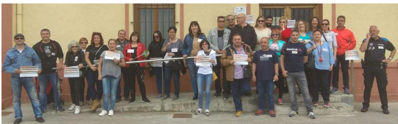
18/05/2018. Concentración en el Ayuntamiento de Castejón. ¡Por una plantilla justa!

El autor es secretario general de la Federación de Servicios a la Ciudadanía de CCOO Navarra.