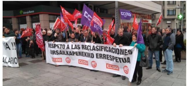
25/03/2019. Nos seguimos movilizando por el respeto del Acuerdo de Reparto de Fondos Adicionales en el Gobierno de Navarra