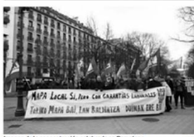
Imagen de la concentración celebrada en Pamplona.

11/01/2019. Concentración por el cumplimiento del Acuerdo de Reparto de Fondos Adicionales en el Gobierno de Navarra